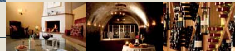
AM FUSSE DES WEINBERGS