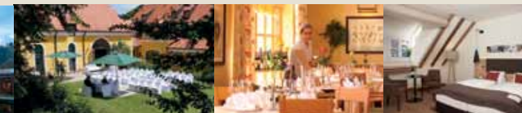
HOTEL ALTHOF RETZ

Luftig und hell wirkende Räumlichkeiten, sowie großzügige Terrassen, laden zum Verweilen ein.