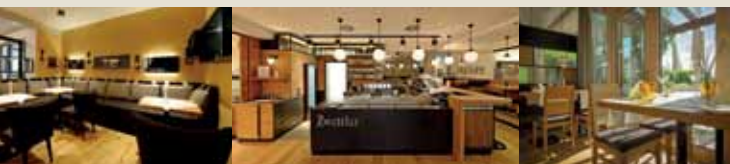
DIE NEUE WALDVIERTLER GASTLICHKEIT