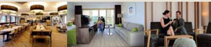
HOTEL SCHWARZ ALM ZWETTTL

informiert Sie gerne über sämtliche Angebote. Wir würden uns freuen, auch Sie bei uns begrüßen zu dürfen.